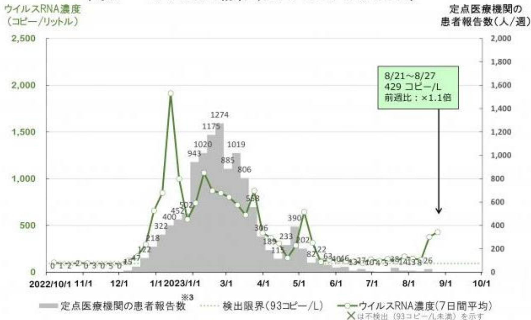
下水サーベイランスの結果（インフルエンザウイルス）

インフルエンザ：検出率及びウイルス濃度は増加傾向が続いており、感染の面的な広がりには注意が必要です。